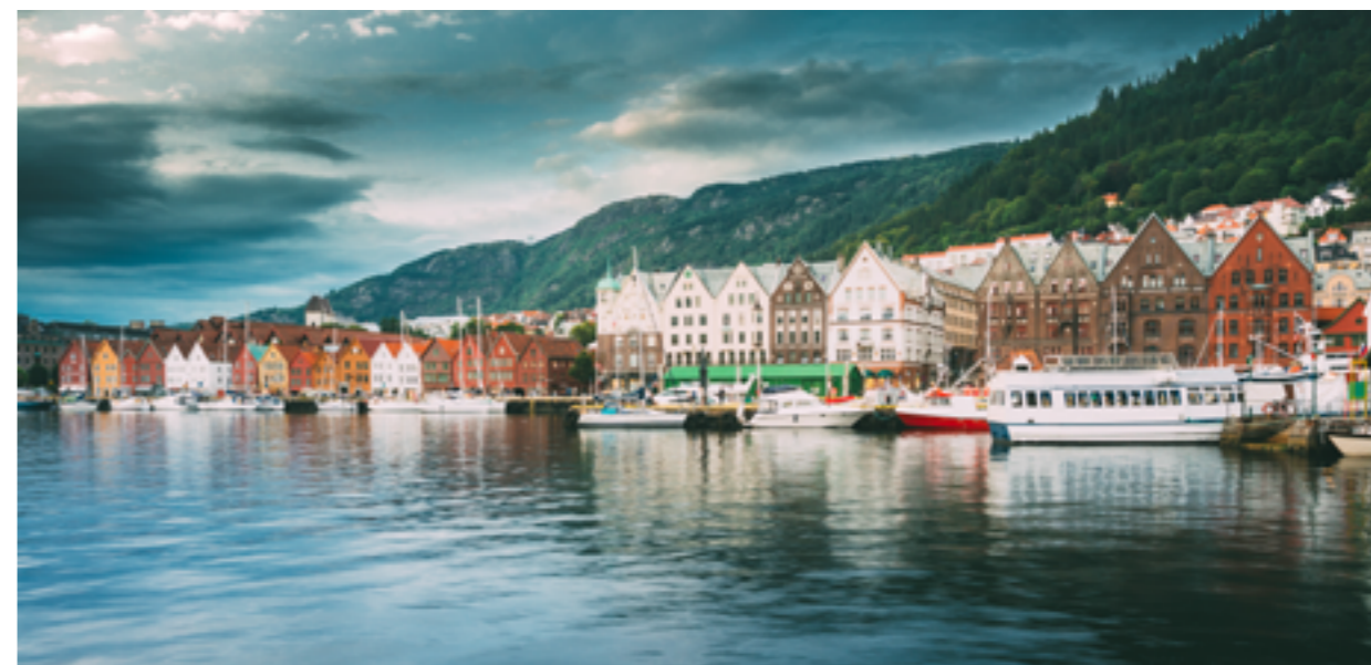
Bryggen i Bergen