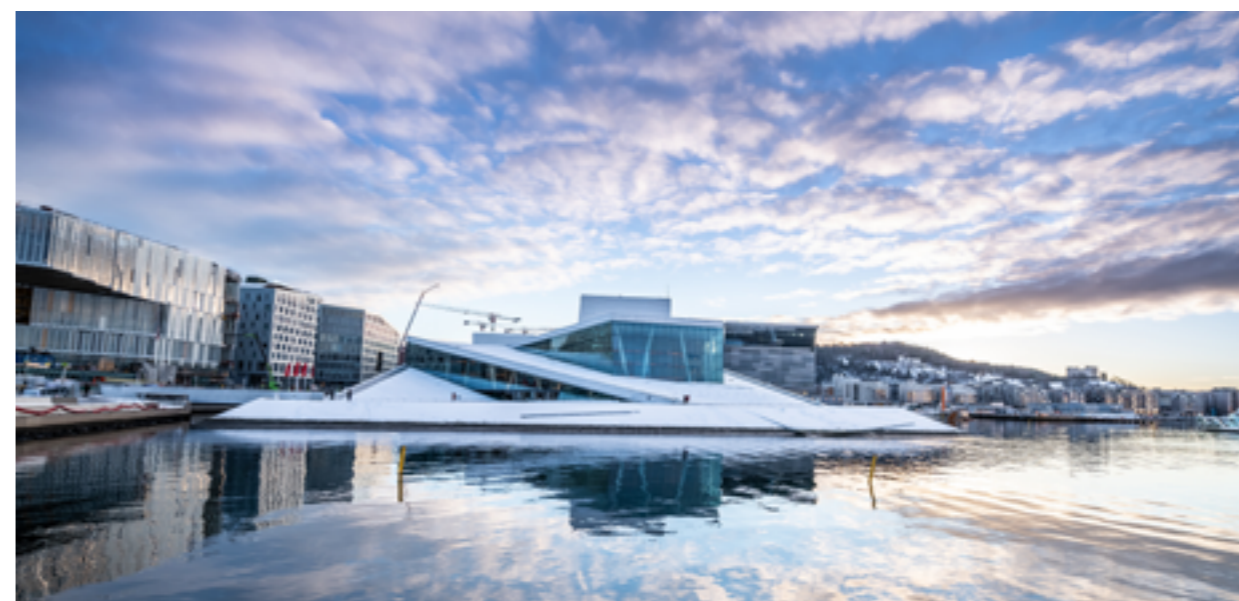
Operaen i Oslo