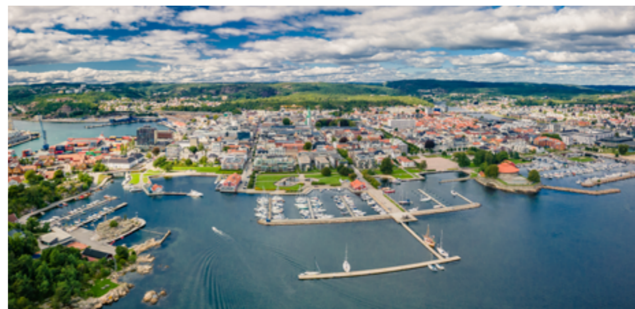
Kvadraturen i Kristiansand